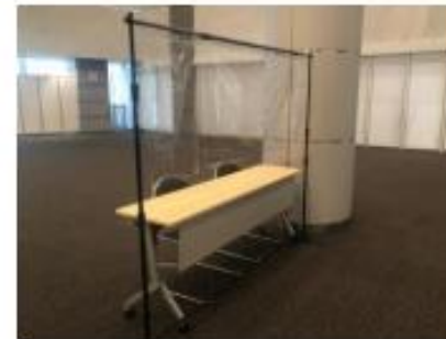
受付用飛沫防止シート