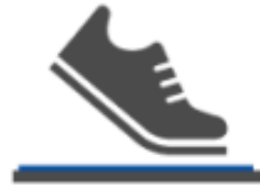
当施設入口に 靴底消毒用マットを設置