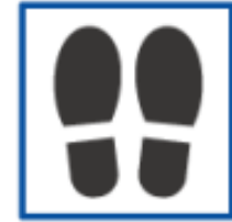
トイレなどに整列用の 足型マークの設置