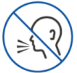
日常会話レベル以上の 声量で発声する行為の制限