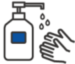
入館時の手指消毒