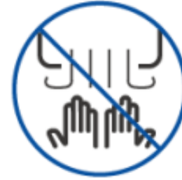
ハンドドライヤーの停止 ペーパータオルの設置