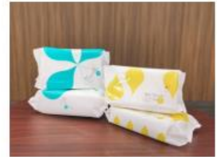
アルコールスプレー 及び 消毒用ウェットティッシュ