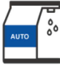
アルコール自動ディスペンサー 各所設置