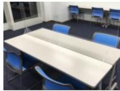
控室用飛沫防止パネル