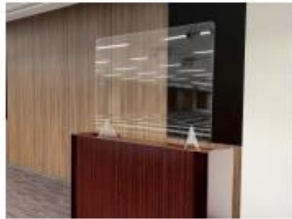
演台用アクリルパネル